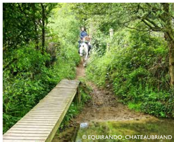
Passage à gué : possibilité de traverser sur la passerelle ou dans l'eau.