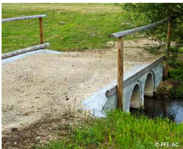
Pont : revêtement et largeur adaptés au passage des cavaliers et attelages.