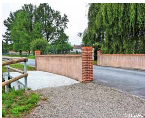
Chemin longeant la route : passage sécurisé pour les chevaux au niveau d'un pont.