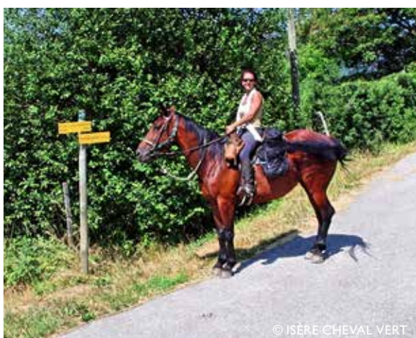
Panneau indiquant l'itinéraire à suivre.